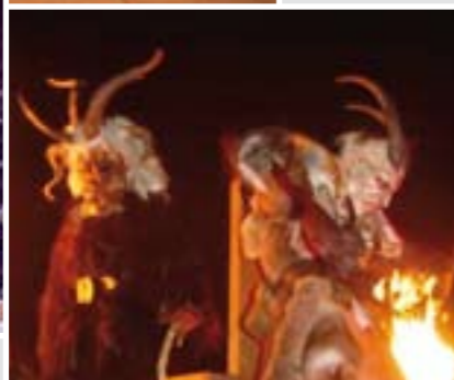
Krampusse beim Anifer Perchtenlauf

Sie sind wilde Gestalten, die Krampusse und Perchten. Bei den beliebten Krampusläufen ziehen sie ab Anfang Dezember mit Gebrüll und Glockengeläut durch Salzburgs Straßen und durch die Umlandgemeinden und treiben ihr Unwesen. Sanft und liebenswert ist hingegen der Nikolaus, der am 6. Dezember seine Geschenke an brave Kinder verteilt.