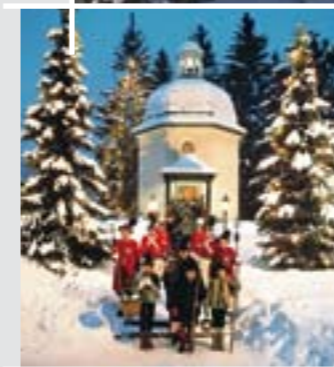
Stille Nacht-Kapelle in Oberndorf

Romantische Legenden ranken sich um die Entstehung des weltbekanntesten Weihnachtsliedes „Stille Nacht, heilige Nacht“. Im Winter 1818 erklang es zum ersten Mal in der St. Nikolaus-Kirche in Oberndorf, rund 20 Kilometer nördlich von Salzburg. Die Melodie des Liedes wurde von Franz Xaver Gruber geschrieben, der Text stammt von Joseph Mohr, einem Salzburger Pfarrer. Inzwischen wurde das Lied in mehr als 170 Sprachen übersetzt und Jahr für Jahr kommen tausende Besucher um den Entstehungsort aufzusuchen.