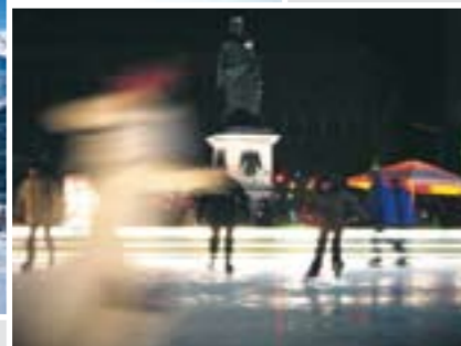
Eislaufen zu Füßen Mozarts