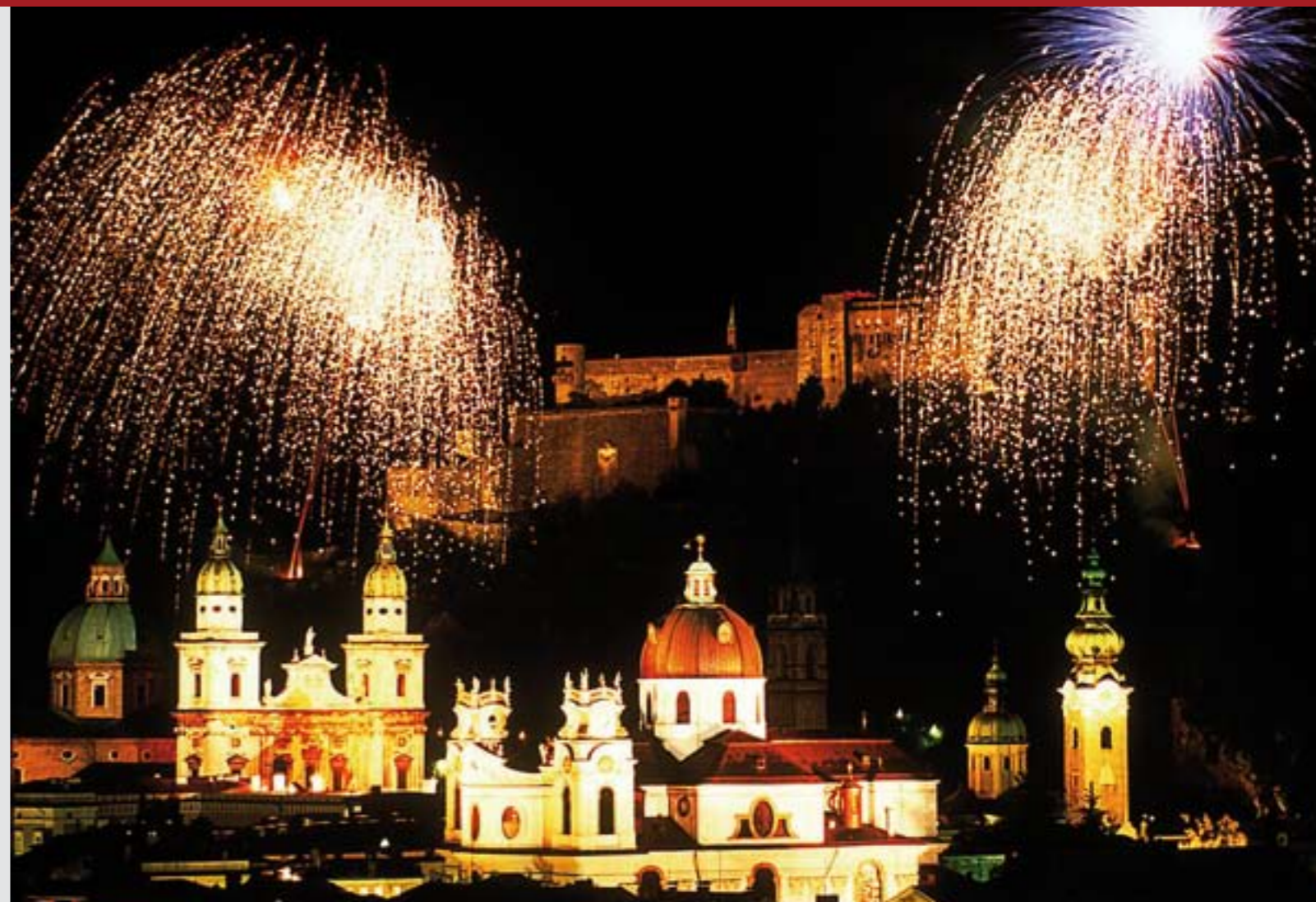
Festung Hohensalzburg mit Silvesterfeuerwerk