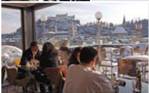
Steinterrasse mit Blick auf die Festung Hohensalzburg