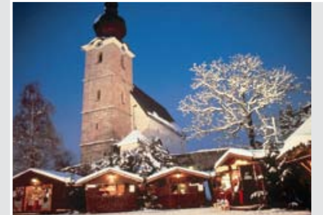
Adventmarkt in St. Leonhard bei Grödig

Auf der Suche nach besonderen Weihnachtsgeschenken für besondere Menschen wird man in Salzburg fündig. Etwa auf einem der wohl stimmungsvollsten Weihnachtsmärkte der Welt, dem Salzburger Christkindlmarkt. Vor der imposanten Fassade des Doms und rund um den barocken Brunnen am Residenzplatz werden Christbaumschmuck, Krippenfiguren, Spielzeug, Lebkuchen und allerlei Kunsthandwerk feilgeboten. Der Duft von Glühwein, Bratäpfeln und Maroni weckt so manche Kindheitserinnerung. Abseits vom bunten Treiben erlebt man leisere Momente beim Besuch einer der Krippen in den Kirchen, weithin hörbar sind das Advent-Einläuten aller Salzburger Kirchenglocken und das Adventblasen vom Turm des Glockenspiels.