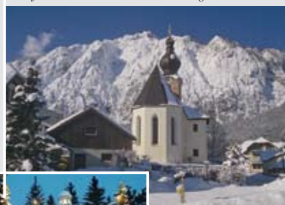
Wallfahrtskirche St. Leonhard bei Grödig