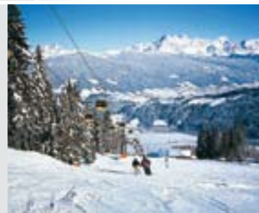
Skispaß im Salzburger Land

Vor den Toren der Stadt Salzburg eröffnet sich dem Wintersportler ein wahres Paradies. Die weltbekanntesten Skigebiete des Salzburger Landes lassen sich mit dem Salzburg Snow Shuttle direkt von der Stadt aus bequem erreichen.