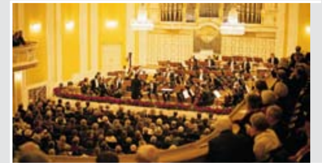
Konzert im Mozarteum

Zu Silvester und Neujahr ist die Stadt Kulisse und Bühne zugleich für viele abwechslungsreiche Veranstaltungen. Zu den Höhepunkten des Nachmittags des letzten Tages im Jahr zählt das traditionelle Neujahrs-Sternschießen der Prangerstutzen- und Weihnachtsschützen und der Bürgergarde. Licht und Soundtürme werden entzündet, multimediale Effekte und Musik beleben das Straßenbild. Kabarettvorstellungen, Gala, Konzerte, Theateraufführungen oder das Winterfest im Theaterzelt im Volksgarten bieten Unterhaltung für jeden Geschmack. Das Silvesterprogramm auf der Bühne am Residenzplatz mit seinen Open Air-Konzerten und kulinarischen Schmankerln führt schwungvoll durch die letzten Stunden des alten Jahres. Nach dem Countdown vor Mitternacht wird das neue Jahr mit dem Läuten der Kirchenglocken und einem phantastischen Feuerwerk begrüßt, Walzerklänge laden zum Tanz ins neue Jahr ein.