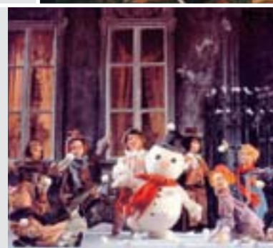
Der Nussknacker, Marionettentheater

Die Fülle an kulturellen Veranstaltungen und anderen winterlichen Glanzpunkten ist typisch für Salzburg und seine lebensfrohen Menschen. Zu den berühmtesten zählt das Salzburger Adventsingen im Großen Festspielhaus, doch auch die festlichen Konzerte im Schloss Mirabell, den Kirchen und auf der Festung Hohensalzburg sowie Aufführungen im Landestheater und im Marionettentheater ziehen Besucher aus nah und fern in die Stadt.