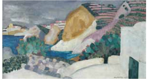
Agnes Muthspiel, E Isola Ponza, 1952. Öl auf Hartfaserplatte, 44 × 78 cm