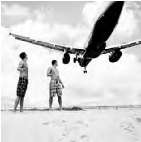
Josef Hoflehner, Jet Airliner #27, United Airlines Airbus A320, Arriving from Chicago-O'Hare, IL, St. Maarten, 2010. Silver gelatin print; Ed. 5, 100 × 100 cm