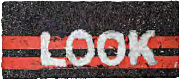
Michael Scheirl, Look, 2009. Mixed media, 70 × 30 cm