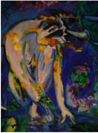
Roman Scheidl, Nachmittag mit Elis (Detail), 2010. Öl/Leinwand, 160 × 200 cm