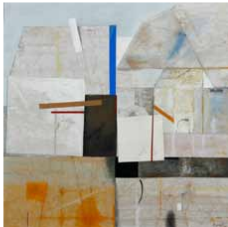
Karl Korab, Die weißen Häuser, 2005. Gouache mit Collage, 39 × 46 cm