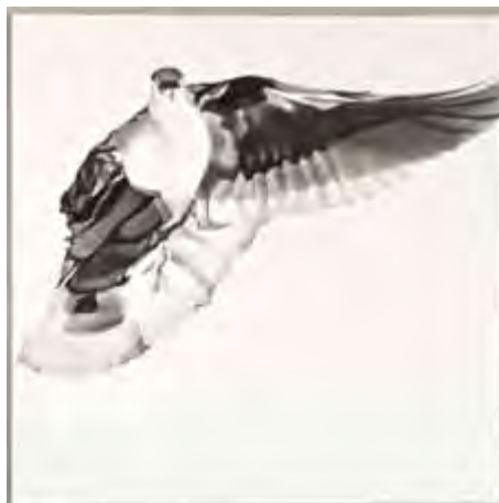
Marc Brandenburg, Untitled, 2010. Graphite on paper, 50 × 50 cm