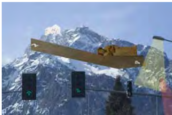
Aurelija Maknytė, Markus Kircher, Untersberg, 2010. Farbfotografie, 80 × 120 cm