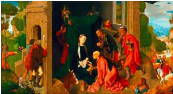
Meister der Virgo inter Virgines, Anbetung der heiligen drei Könige, Salzburg um 1940. Tempera auf Eichenholz, 98 × 182 cm.