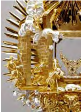
W. Lackner, Weihnachtsmonstranz (Detail), um 1725