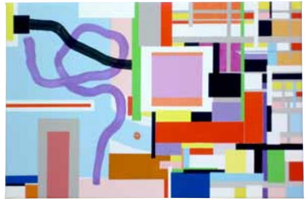
Hermann Wolf, Landscape, 2009. Acryl/Lw, 30 × 45 cm