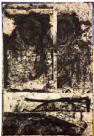
Valentin Oman, Terra incognita, 2002. Mischtechnik/Leinwand, 120 × 80 cm