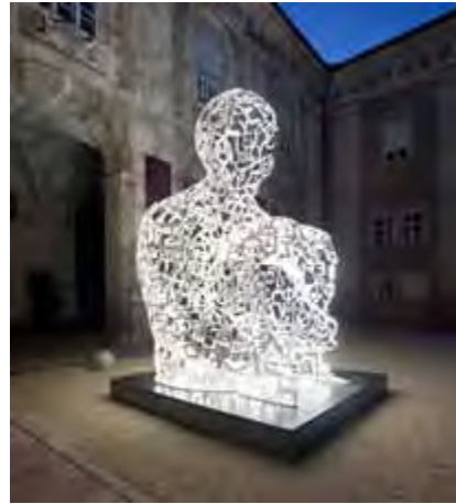
Jaume Plensa, We, 2008. Painted steel, 570 × 400 cm

30 Jahre Galerien Weihergut 20. 11. 2010 – 15. 1. 2011