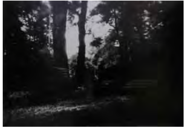
Eva Schlögl, aus der Serie »Still, still, still, weil's Kindlein schlafen will«, 2010 Baryprint, 100 × 140 cm