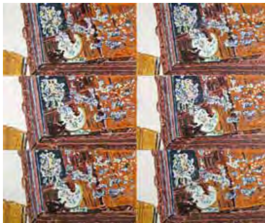
Norbert Trummer, Spiegel, 2010. Eitempera auf Holz, 42 × 50 cm