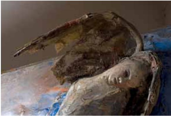
Alessandro Kokocinski, Come la tempesta senza fine I (Detail) , 2010 Mischtechnik und Fiberglas auf Holz, 200 × 200 × 60 cm