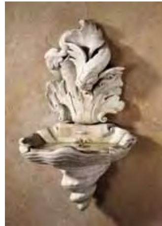
Wandbrunnen mit Delphin, Rom, 17. Jh. weißer Marmor