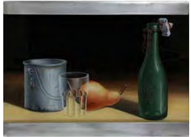
Nature morte, 2010. Hinterglasmalerei, 23 × 32 cm