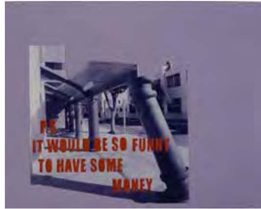
Maruša Sagadin, Everybody says Hi to Hans because Hans says Hi to everybody, 2010. Collage, 61 × 48 cm