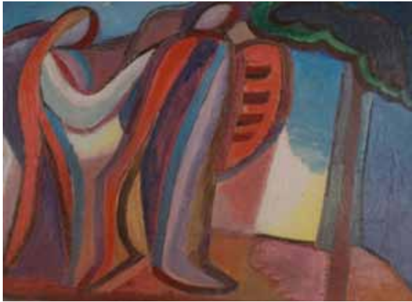
Kurt Weber, Tamino und Pamina, um 1938. Öl auf Platte, 72 × 102 cm